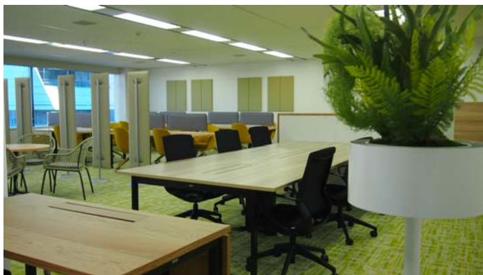
関東支社新事業所内の様子

所在地の詳細はこちら http://www.r-lease.co.jp/info/company/map/kanto.html